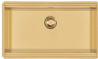
Fregadero Milanello Gold Workstation