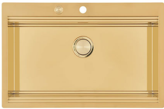
Fregadero Milanello Gold workstation