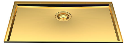
Fregadero Phantom Base Gold